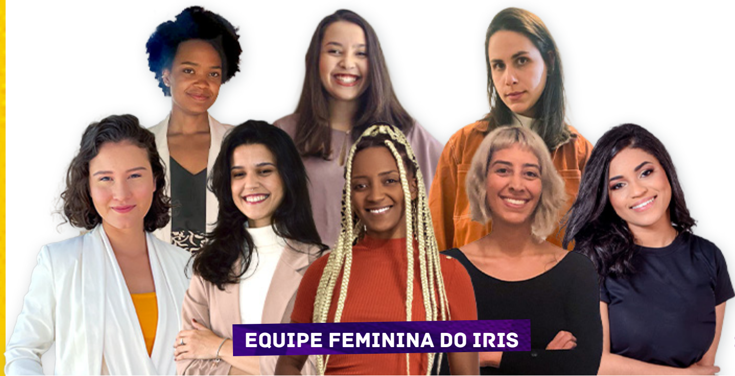
EQUIPE FEMININA DO IRIS

Os dados pessoais apresentados nesta cartilha foram obtidos em observância do art. 7º, I, da Lei Geral de Proteção de Dados Pessoais (LGPD - Lei nº 13.709/2018). As informações foram obtidas através de um formulário digital preenchido individual e optativamente pelas titulares, que foram previamente informadas sobre os limites e propósitos desse tratamento*