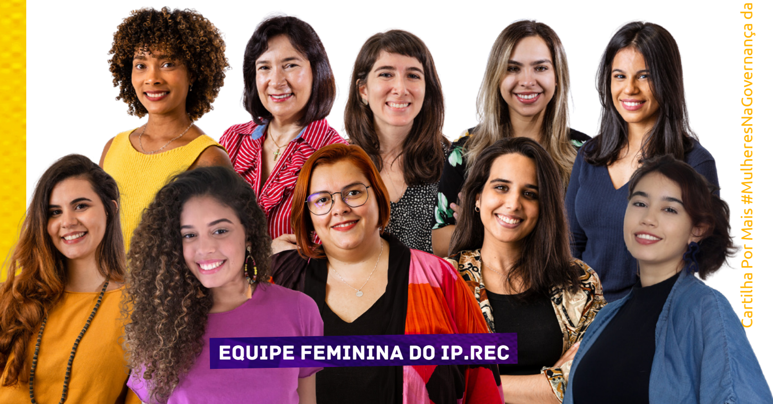
EQUIPE FEMININA DO IP.REC

A partir das questões que surgiram no FIB7, a iniciativa de mapear mulheres que trabalham e pesquisam na Governança da Internet no Brasil surge como estratégia para acompanhar e destacar a diversidade de vozes e atuações que essas mulheres representam e participam ativamente.